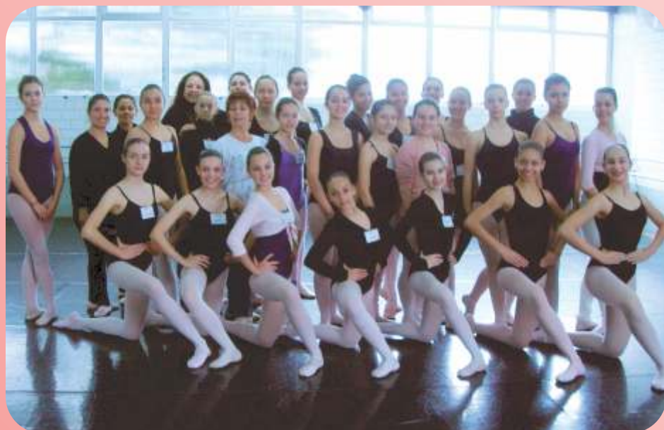
o grupo dos Inters